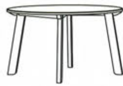
Table x 1